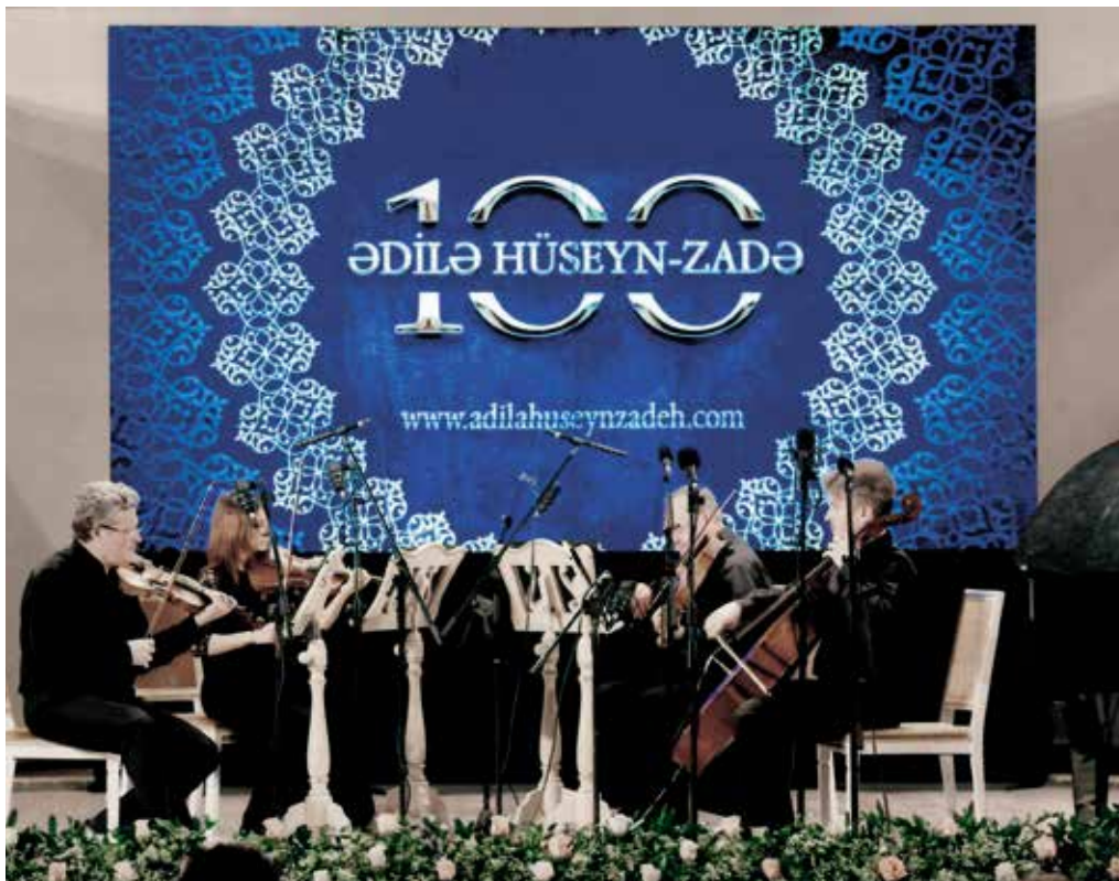
На праздновании столетия со дня рождения Адили Гусейнзаде